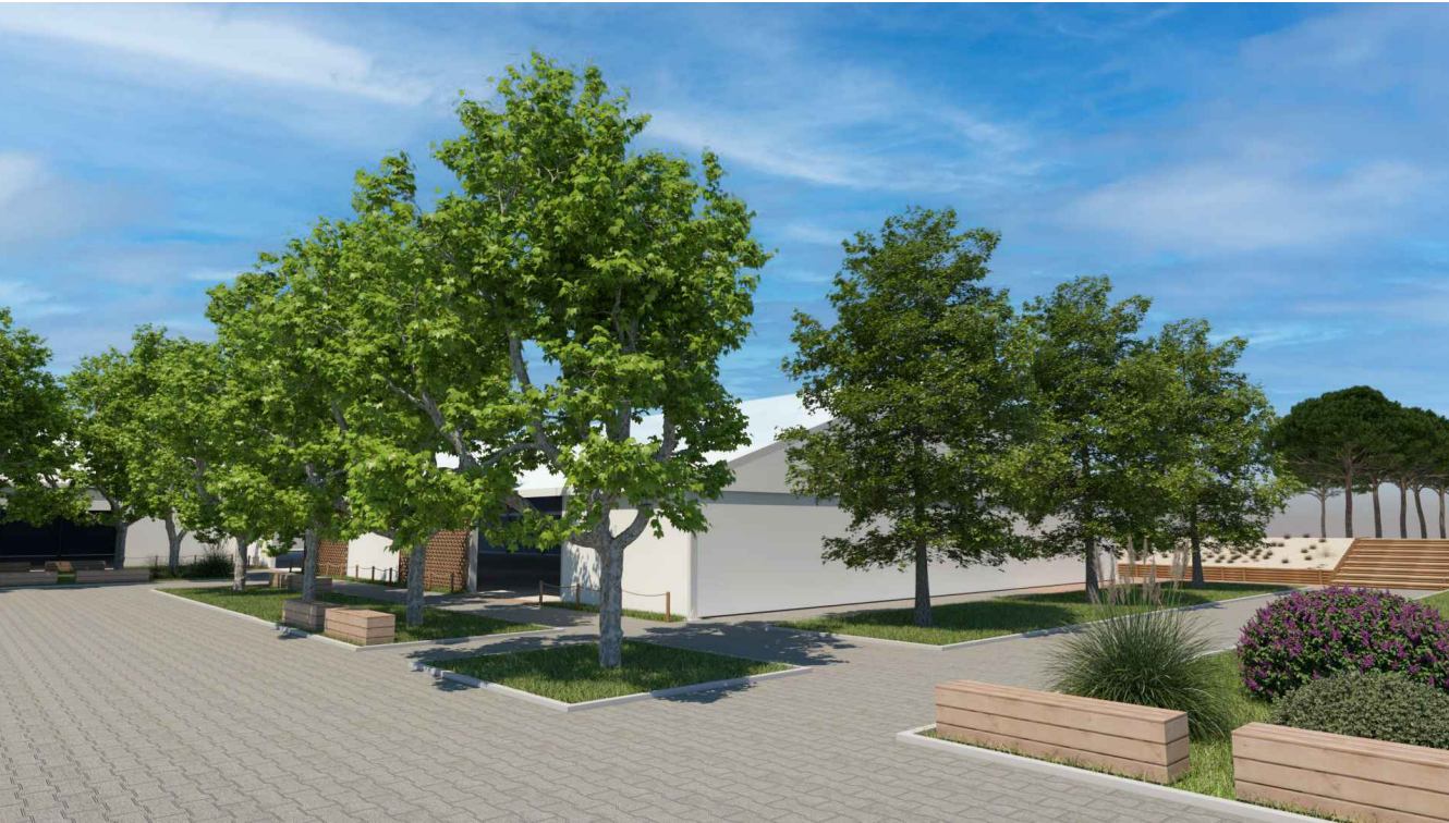
VISTA LATO SUD