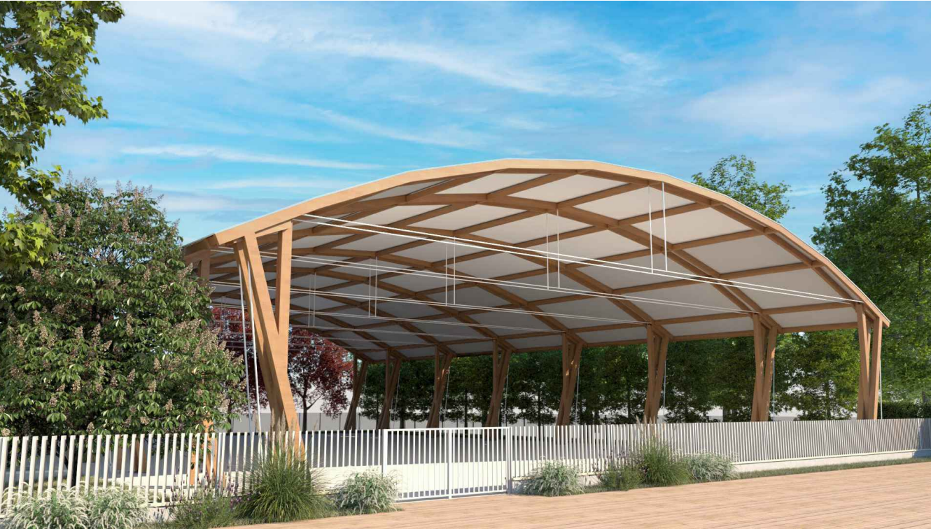
VISTA LATO NORD