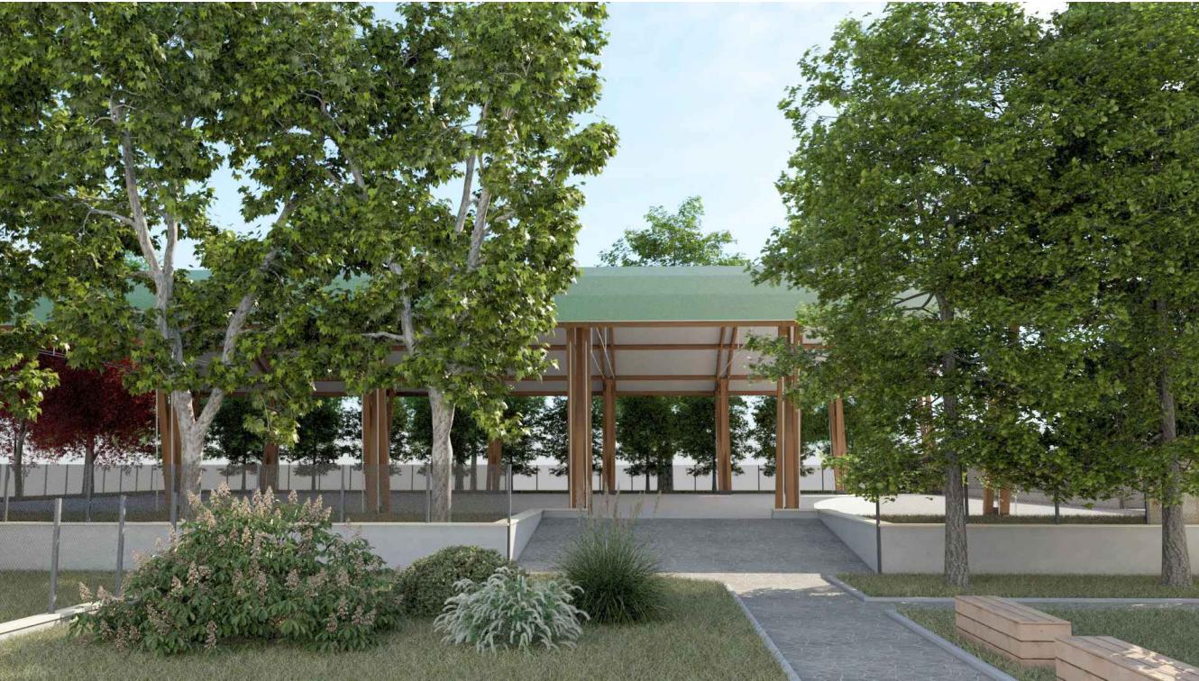
VISTA LATO NORD - EST