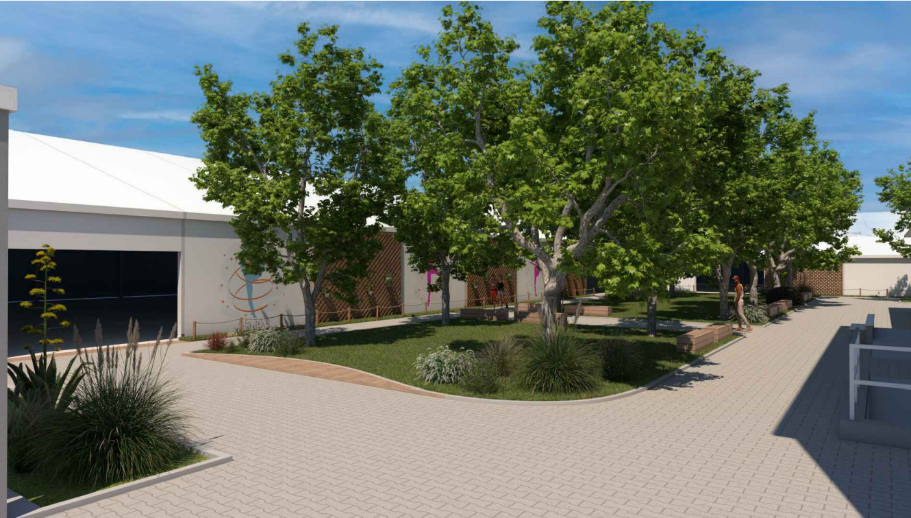
VISTA LATO SUD - OVEST