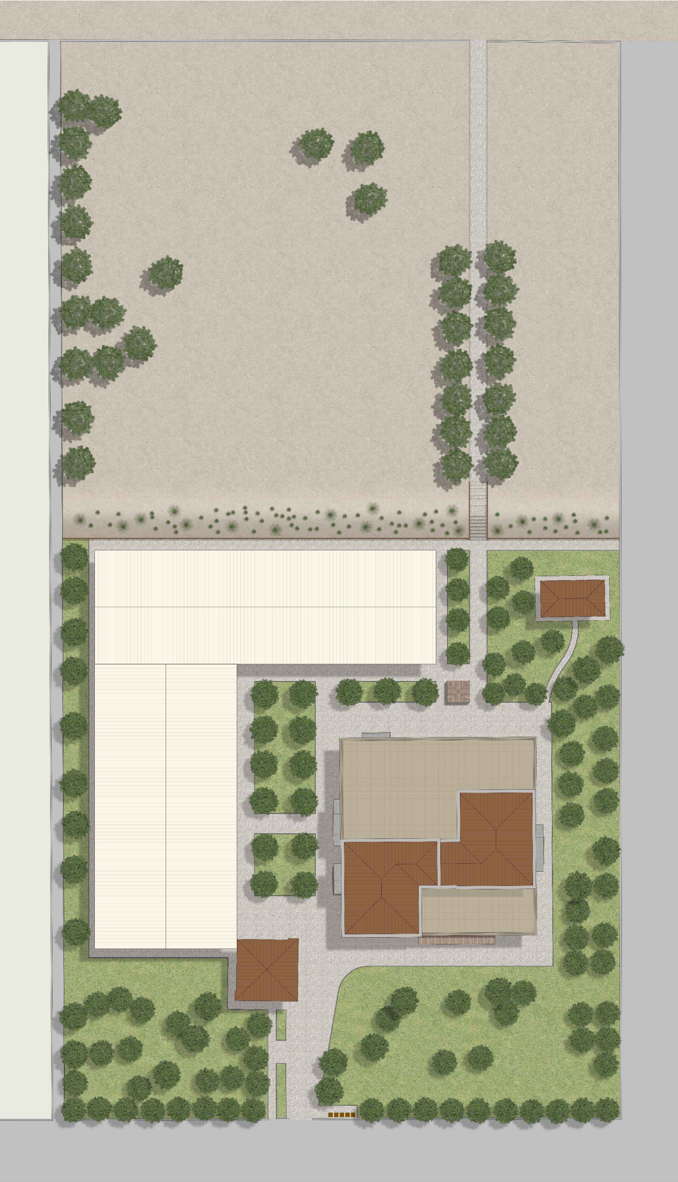
PLANIMETRIA SCALA 1:500